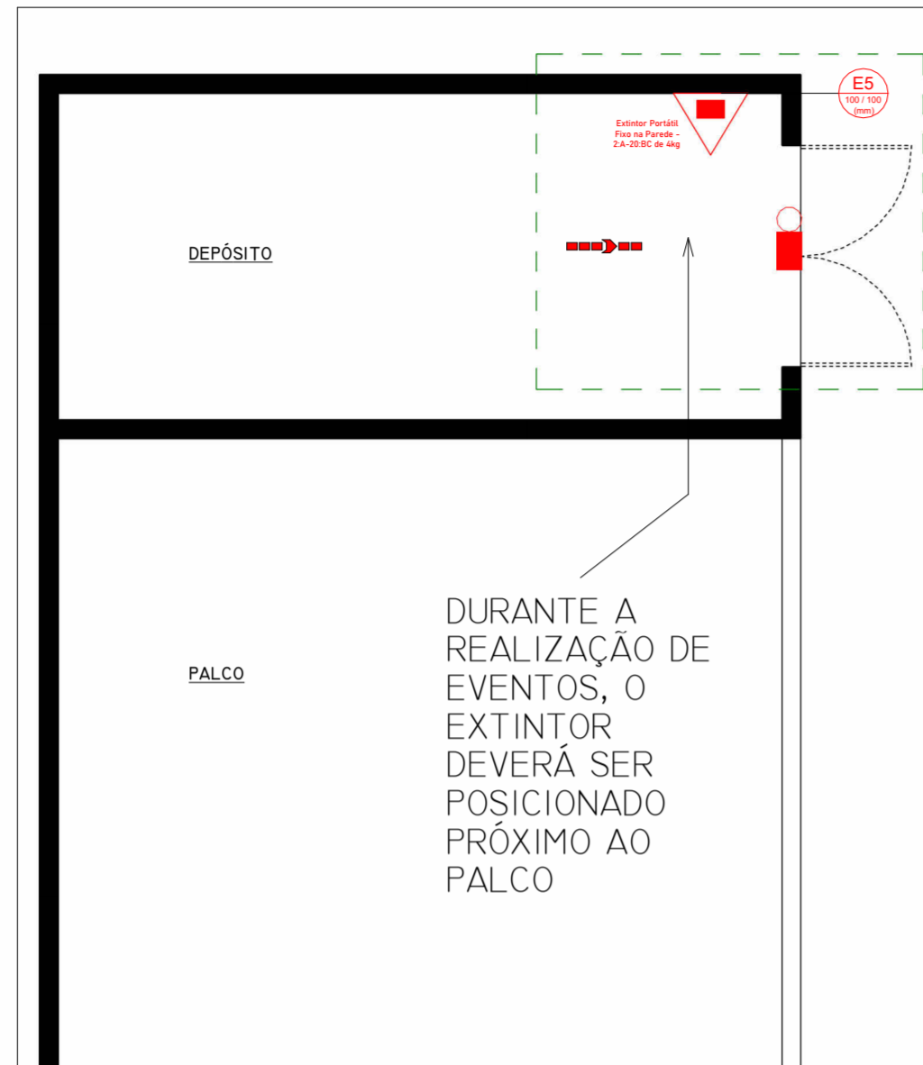
DETALHE DEPÓSITO 1:50