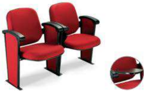
Imagem de referência item 05