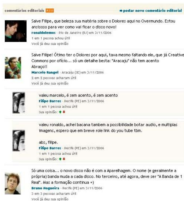
Figura 04: Comentários sobre o texto na fila de edição.

Os comentários na fila de edição cumprem um papel importante dentro do processo de difusão da notícia. No Overmundo o papel do editor é descentralizado, tudo é feito pelos próprios colaboradores, que enviam seus comentários durante o tempo em que a matéria está na fila de edição. No texto analisado, foram feitos três comentários de outros usuários, dois propondo correções no texto e um elogiando a matéria (ver figura 3). Os usuários têm a opção de opinar sobre os comentários, com um clique que aponta se as sugestões feitas por outrem possuem relevância ou não. As correções, neste caso, foram fundamentais para corrigir um erro ortográfico e uma falha de apuração.