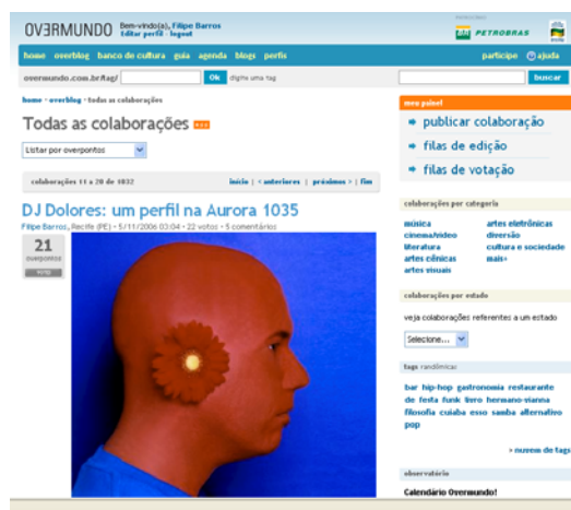
Figura 06: Publicação da matéria

quantas vezes desejar. A figura 5 apresenta a matéria já publicada no Overblog, após atingir os pontos necessários 11 .