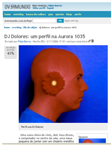
Figura 03: Colaboração na fila de edição

O texto permanece na fila de edição por 48 horas. Durante essa etapa, o proponente poderá receber sugestões dos demais usuários através dos comentários. Nesse tempo, o colaborador pode alterar todo o conteúdo da matéria, para evitar erros dos mais variados tipos, adicionar vídeos, áudio e múltiplas imagens. A figura 2 apresenta a colaboração na fila de edição, no lado esquerdo o usuário acompanha o tempo restante na fila de edição.