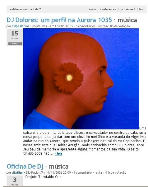
Figura 05: Texto na fila de votação.

Uma matéria para ser publicada precisa receber no mínimo 60 pontos no tempo máximo de 48 horas, no qual a contribuição permanece na fila de votação. Não podemos desprezar as implicações lúdicas da participação que se assemelha a um “game”, no qual para atingir mais overpontos, o usuário necessita participar mais ativamente. Por exemplo, um colaborador que deseje ver o seu texto no ar provavelmente incitaria seus amigos a votarem, e com isso também divulgaria o site, estimularia novos usuários ativos, e teria um maior poder de voto. A figura 4 mostra a matéria na fila de votação ainda com 15 pontos.